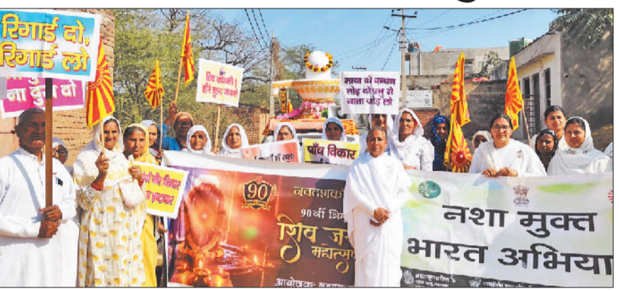
चरखी दादरी। शिव संदेश यात्रा से लोगों को नशा छोड़ने के लिए प्रेरित करती ब्रह्माकुमारी बहन।