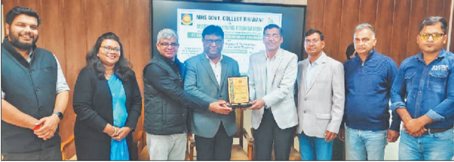
मिवानी। कार्यक्रम में स्मृति चिह्न देकर सम्मानित करते हुए।