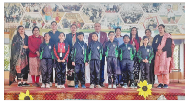
भिवानी। शिक्षकों के साथ विजेता विद्यार्थी।

हलवासिया विद्या विहार के प्राथमिक विभाग में एनवायरमेंटल स्टडी विवज प्रतियोगिता का आयोजन किया। प्रतियोगिता में कक्षा पांचवीं के विद्यार्थियों ने उत्साहपूर्वक भाग लिया। कुल पांच सन, मून, अर्थ, ओशन व माउंटन टीमों का गठन किया। प्रत्येक टीम में पांच-पांच विद्यार्थी शामिल थे। सभी टीमों ने पर्यावरण एवं सामान्य ज्ञान से जुड़े प्रश्नों के सुंदर, सटीक व आत्मविश्वासपूर्ण उत्तर दिए। दर्शकों के रूप में बैठे विद्यार्थियों ने कुछ प्रश्नों के उत्तर देकर अपनी प्रस्तुति दर्ज करवाई,