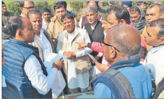
बवानीखेड़ा। लोगों की समस्याएं सुनते विधायक कपूर सिंह वाल्मीकि तथा समस्याएं सुनने के बाद अधिकारियों को निर्देश देते हुए।

शनिवार को बवानीखेड़ा रैस्ट हाऊस में विधायक कपूर सिंह वाल्मीकि के खुले दरबार में हलके में बिजली के लटकते तार, पानी की समस्याओं सहित अनेक समस्याएं छाई रही। विधायक कपूर वाल्मीकि ने संबंधित विभाग के अधिकारियों को समस्याओं को प्राथमिकता के आधार पर निराकरण करने के आदेश दिए। उन्होंने कहा कि इस मामले में किसी तरह की कोताही व लापरवाही बर्दाश्त नहीं होगी। अधिकारी लोगों की समस्याएं व सरकार की घोषित योजनाओं को प्राथमिकता के आधार पर लागू करवाए। ताकि लोगों को सरकारी योजनाओं का लाभ मिल सके। विधायक के खुले दरबार में करीब ढाई सौ शिकायतें मिलीं। जिनमें से संबंधित विभाग के अधिकारियों को फोन पर सूचित करके अधिकांश समस्याओं का निराकरण करवा दिया।