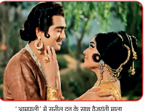
'आम्रपाली' में सुनील दत्त के साथ वज्रयंती माला