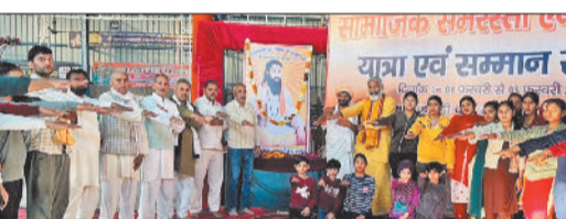
मिवानी। समाज में फैली बुराईयों को मिटाने के लिए जागरूकता अभियान चलाने की शपथ दिलाते हुए।