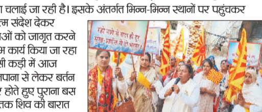
मिवानी। प्रजापिता ब्रह्माकुमारी ईश्वरीय विश्वविद्यालय दिव्य भवन रुद्रा कॉलेजी की ओर से शिवरात्रि महापर्व के उपलक्ष्य में शिवरात्रि महोत्सव की श्रृंखला चलाई जा रही है।

मिवानी। प्रजापिता ब्रह्माकुमारी ईश्वरीय विश्वविद्यालय दिव्य भवन रुद्रा कॉलेजी की ओर से शिवरात्रि महापर्व के उपलक्ष्य में शिवरात्रि महोत्सव की श्रृंखला चलाई जा रही है। इसके अंतर्गत मिन्न-मिन्न स्थानों पर पहुंचकर परमात्म संदेश देकर